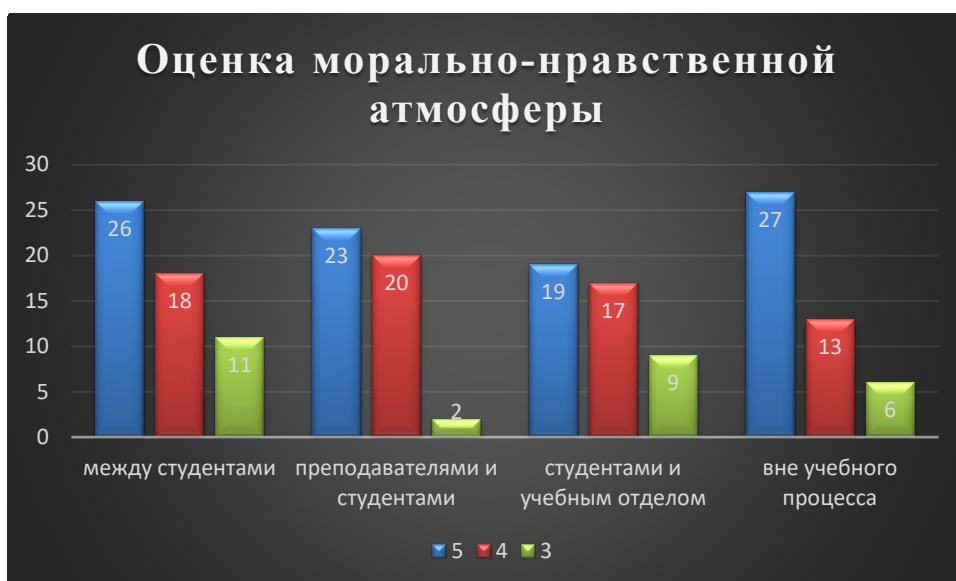
Рис. 5. Оценка морально-нравственной атмосферы и психологического климата

Оценка морально-нравственной атмосферы и психологического климата в колледже показала, что большинство опрошенных оценивают морально-нравственную атмосферу как позитивную (63%) и нейтральной (37%) (см. Рис.5).