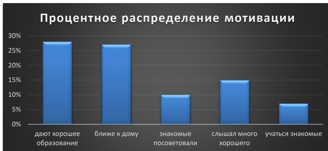
Рис. 1. Процентное распределение мотивации обучения

Второй блок вопросов анкеты касался качества условий обучения и материально-технической базы в колледже. Распределение среднего балла качественной оценки условий обучения и материально-технической базы в колледже (при максимальном балле – 5) представлено в таблице 1 и таблице 2.