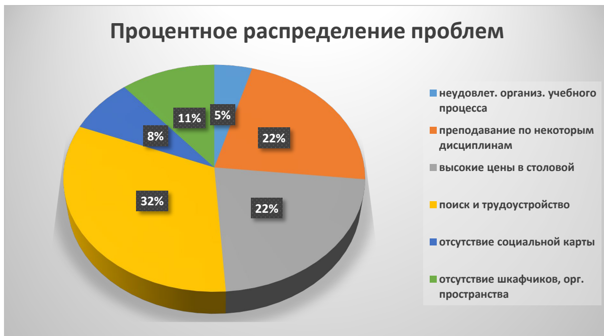
Рис. 6. Процентное распределение студенческих проблем, по мнению опрошенных

Таким образом, цель процедуры анкетирования полностью оправдана, так как удалось выявить степень удовлетворённости обучающихся и установить уровень качества образовательной деятельности. Наряду с большим количеством преимуществ, имеются и некоторые недостатки, требующие внимания со стороны руководства.