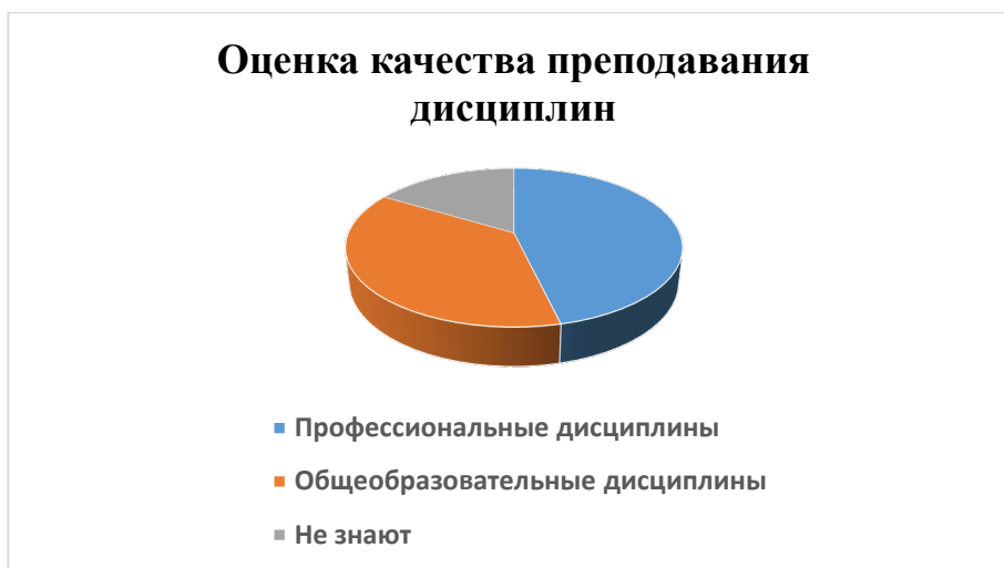
Рис. 4. Оценка качества преподавания

Оценка морально-нравственной атмосферы и психологического климата в колледже показала, что большинство опрошенных оценивают морально-нравственную атмосферу как позитивную (63%) и нейтральной (37%) (см. Рис.5).